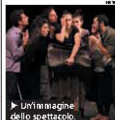
► Un'immagine dello spettacolo.

etica e canzone ore, seguito domani lues di Fabrizio Poggi icken Mambo (ore 1, euro 15). Domani spazio 211, invece, si rà col combo croato llie and the Kids, fra ythum and blues eme e anni 50 (ore 22.30, 8). • DIEGO PERUGINO