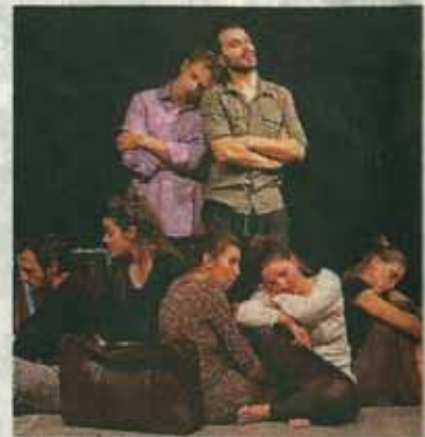
«Strani-ieri» di Simone Schinocca

nella città della Fiat. In apertura, Matera: ci sono donne sul ciglio di un dirupo, che urlano forte il nome dei propri uomini partiti per la metropoli fredda e lontana. Poi i quadri cambiano, dalla Sicilia alla Campania, tra Veneto, Basilicata e Piemonte si delinea il viaggio su quello che veniva chiamato il «treno del sole», poi l'arrivo, l'ambientazione, il lavoro, la fabbrica, la casa, il primo ritorno nella terra natale, le prospettive per il futuro. Sullo sfondo, il contesto storico e sociale del periodo eviden-