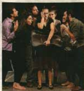
Una scena di «Strani-ieri»

«Musica, parole e ricordi, quelli delle persone che tra il 1950 e il 1970 hanno abbandonato il sud Italia per raggiungere il più ricco nord. Storie raccolte dai ragazzi, discendenti di quell'ondata di immigrazione che ha riempito tante città del settentrione e Torino in particolare. Si intitola «Strani-ieri», lo spettacolo che l'associazione Tedacà presenta da oggi (ore 21) a domenica al teatro Astra. Sul palco, le vicende di uomini e donne che hanno lasciato le proprie case per intraprendere un viaggio carico di speranze con tanti sacrifici. Una storia narrata con parole e immagini create attraverso corpo, movimento e voce, sulle note della ban-