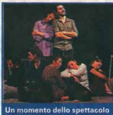
Un momento dello spettacolo

→ Ad inaugurare il 2011 della stagione Teatro Piemonte Europa, uno spettacolo che racconta il flusso migratorio meridionale nella Torino degli anni Cinquanta e Settanta: stasera e domani alle 21 al Teatro Astra, si accendono i riflettori su "Strani-ieri". Sul ciglio di un dirupo alcune donne urlano dei nomi, sono quelli dei loro mariti, partiti verso le terre del Nord in cerca di fortuna. La storia, raccontata con ironia, riporta alla memoria il viaggio di milioni di contadini del Sud Italia che tra il 1957 e il 1967 lasciarono le campagne per inseguire una speranza di sopravvivenza rac-